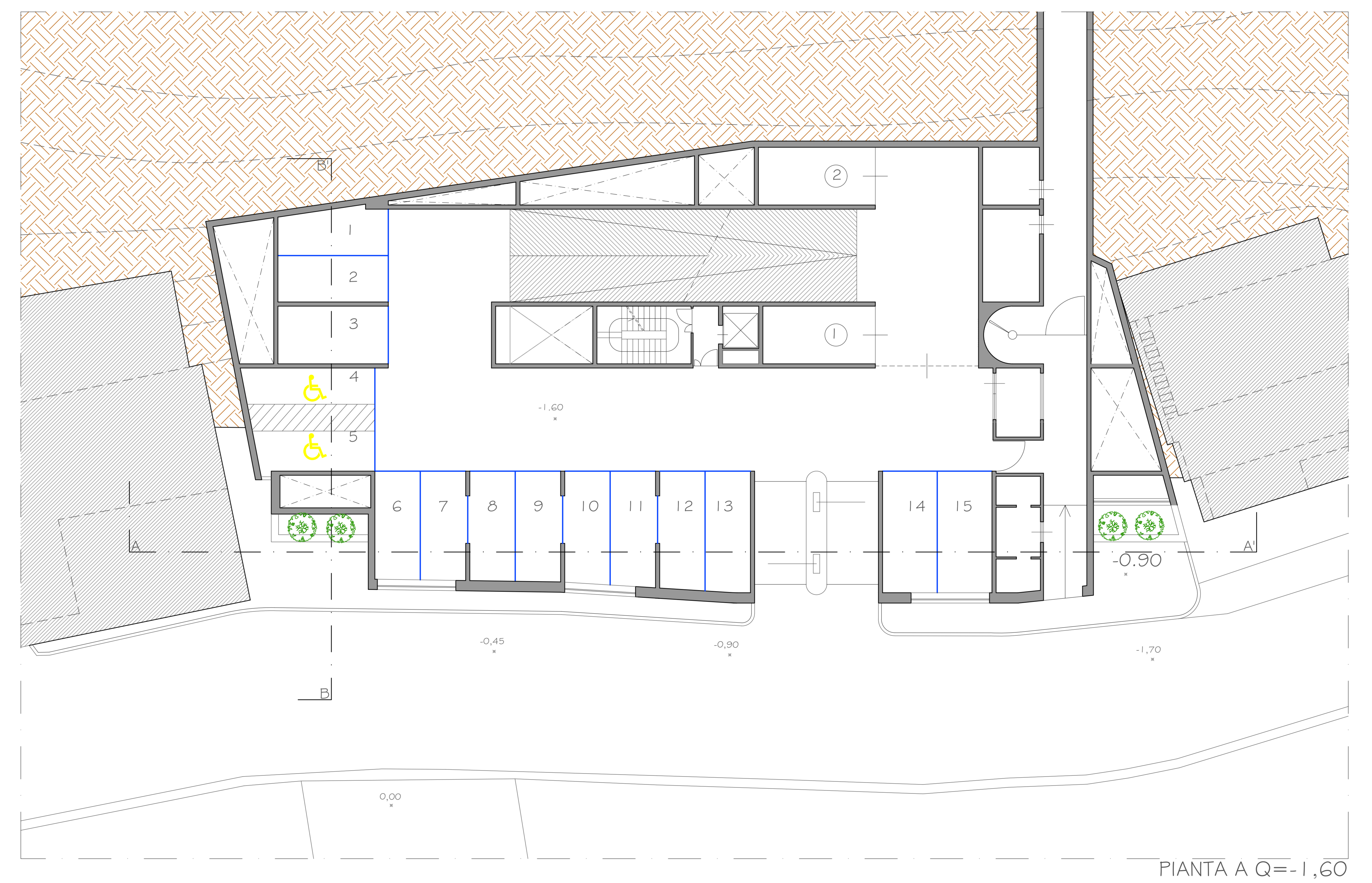
PIANTA A Q=-1,60