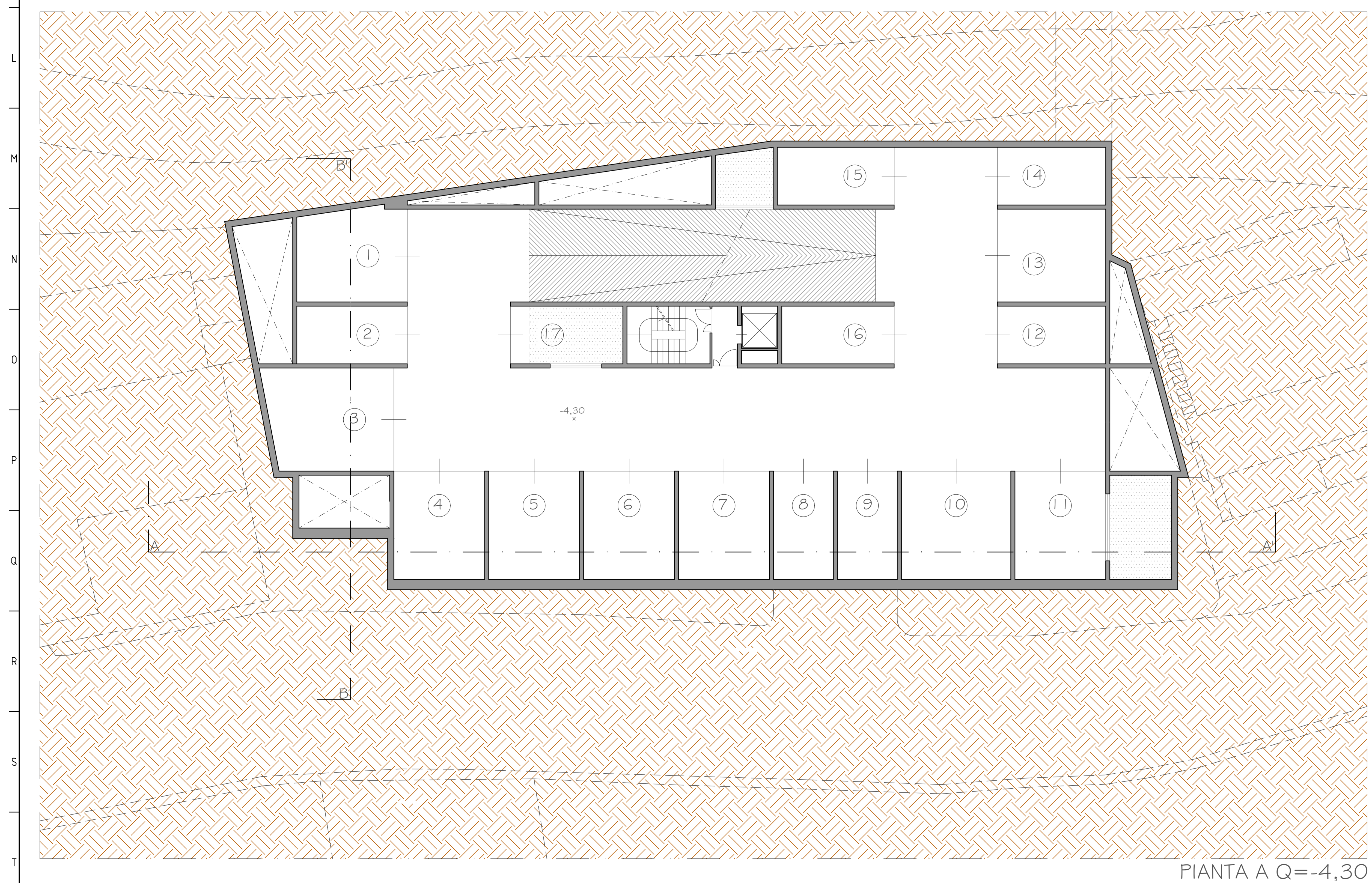
PIANTA A Q=-4,30